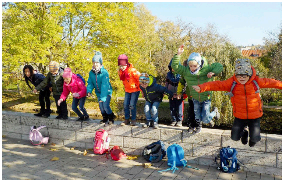
In den Herbstferien gab es für die Schüler wieder spannende Spiele an der Christian-Morgenstern-Grundschule.

In den diesjährigen Herbstferien bot die Stadt Tauberbischofsheim an der Christian-Morgenstern-Grundschule wieder ein spannendes Betreuungsangebot für Erst- bis Fünftklässler an.