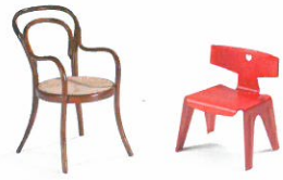
Abteilung 4 Umgebung für kleine Menschen Kindergarten und Montessori-Kinderhaus Section 4 An environment for small people Kindergartens and Montessori children's houses