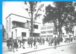
Abteilung 2 Licht, Luft und Sonne Die 1920er bis 1930er Jahre Section 2 Light, air and sunshine The 1920s and 1930s