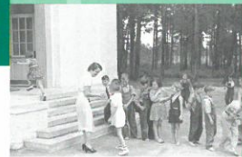
Abteilung 3 Das Kind im Mittelpunkt Internationale Fortschritte bis 1945 Section 3 Focus on the child Progressive international developments up to 1945