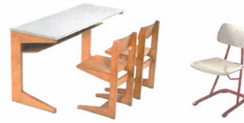
Abteilung 6 Chancengleichheit Bestrebungen der 1960er/1970er Jahre Section 6 Equal opportunities The goal of the 1960s/1970s