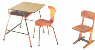
Abteilung 5 Aufbruch in eine neue Ära Schule nach dem Zweiten Weltkrieg Section 5 A new era dawns Schools after the Second World War