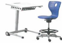
Abteilung 7 Lob der Vielfalt Schule heute Section 7 In praise of diversity Schools today