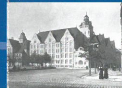
Abteilung 1 Weg von der Kasernenschule Schulreform um 1900 Section 1 Turning away from Prussian severity School reform around 1900