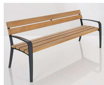
5 Bänke Calma