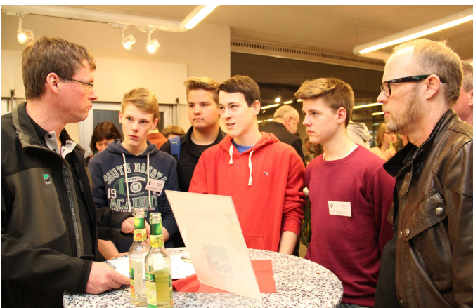
Schüler im Gespräch mit Vertretern der beteiligten Firmen bei der Auftaktveranstaltung 2015 im Gründerzentrum Tauberbischofsheim

Bereits seit dem Jahr 2007 wird mit Unterstützung örtlicher und regionaler Firmen über die Bürgerstiftung Tauberbischofsheim der erfolgreiche Ideenwettbewerb „Kreative Köpfe“ durchgeführt, der sich zum Ziel setzt, Jugendliche wieder für das Thema „Technik“ zu begeistern. Auch im nächsten Jahr macht die Bürgerstiftung wieder mit.