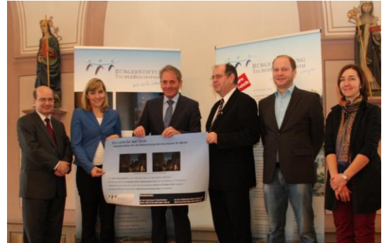
Offizieller Spendenauftakt am 18.11.2014

Dieses stadtbildprägende, höchste Bauwerk der Stadt soll durch die Beleuchtung einen Akzent setzen und die Atmosphäre in der Innenstadt in den Abendstunden und der dunklen Jahreszeit verbessern.