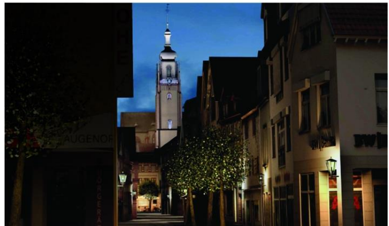
Visualisierung der Beleuchtung des Kirchturms

Offizieller Startschuss der Spendenaktion war am 18. November 2014 mit Bürgermeister Vockel, Dekan Hauk, Nina Warken MdB und Vertretern der Kirche. Dabei wurde erstmals die Visualisierung der geplanten Beleuchtung vorgestellt. Bis zum Jahresende 2014 gingen über 12.000 Euro für die Realisierung des Projekts bei der Bürgerstiftung ein. Da bis zum Betrag von 20.000 Euro jeder gespendete Euro verdoppelt wird, stehen nun schon 24.000 Euro für die technische Umsetzung bereit.